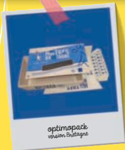
optimapack version Bretagne