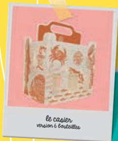
le casier version 6 bouteilles