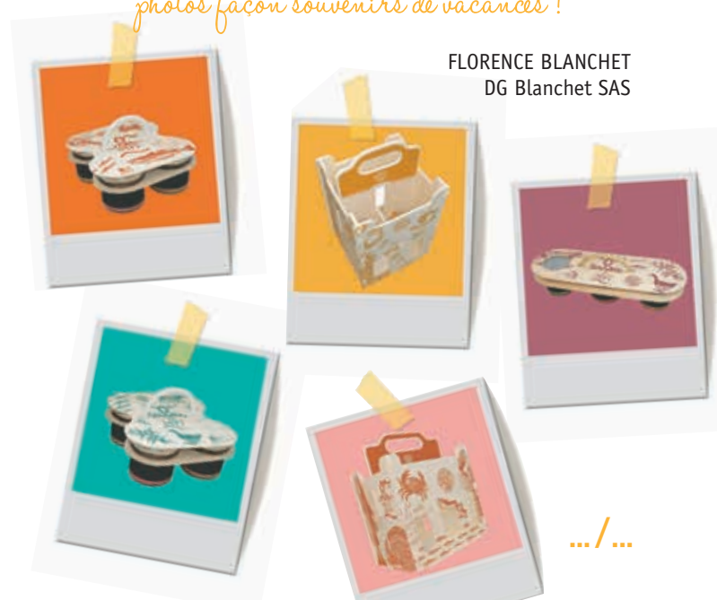
FLORENCE BLANCHET DG Blanchet SAS